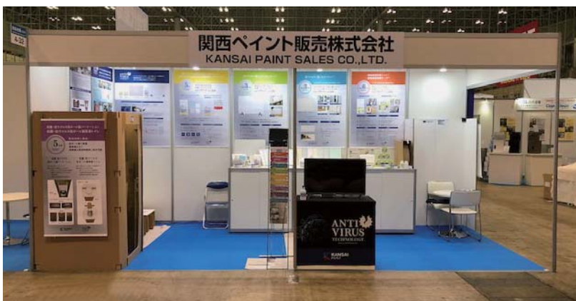
第1回 感染対策 EXPO 東京の様子（2021年10月）