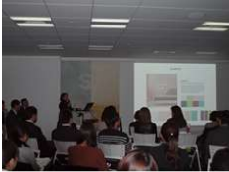
＜東京＞KIP'sによる実例紹介風景