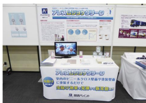
本審査時の展示ブース