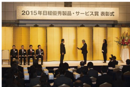
東京都内のホテルで開催された表彰式の様子

関西ペイント並びにカンペハピオは、本賞の受賞を励みに、これからも同製品をはじめとする様々な機能性塗料の普及に努め、みなさまの快適な生活への提案を行ってまいります。