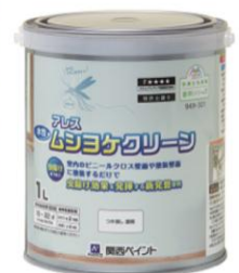
アレスムシヨケクリーン