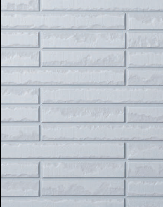
一般的な単色塗装