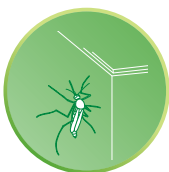
② 壁や天井に止まる