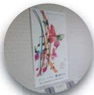
シックイタペストリー