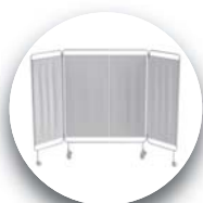
シックイパーテーション