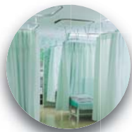
シックイカーテン